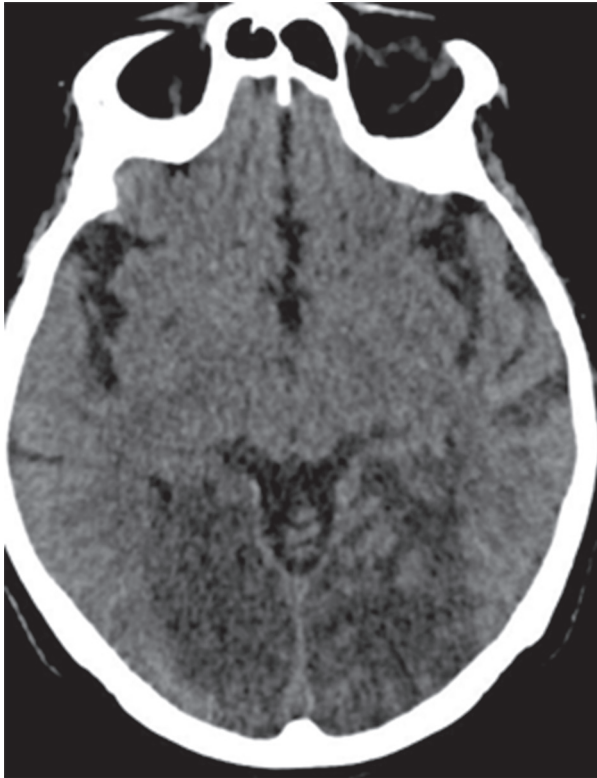
Fig. 1.- Lesión hipodensa bioccipital compatible con isquemia

No se inició tratamiento anticoagulante debido a las lesiones isquémicas recientes de SNC. No se indicó quimioterapia debido al mal performance status . Se produjo su deceso 14 días después del diagnóstico.