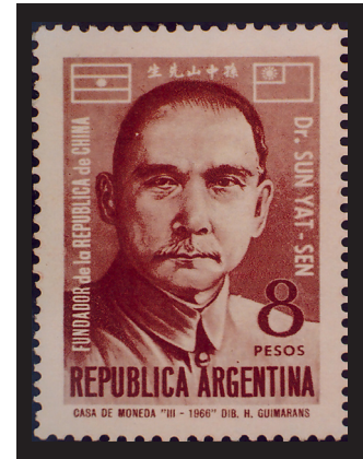
Fig. 16.— Sun Yat-sen. Fundador de la República de China. Correo argentino, 1966.