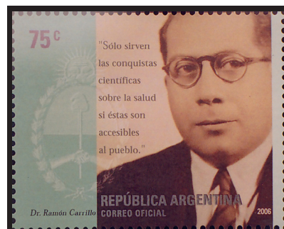
Fig. 15.— Ramón Carrillo. Médico sanitaria. Correo argentino, 2006.