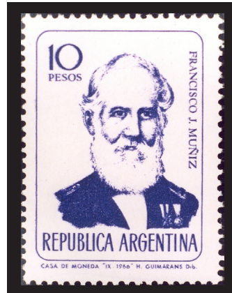
Fig. 13.— Francisco Javier Muñiz. Médico militar y paleontólogo. Correo argentino, 1996.