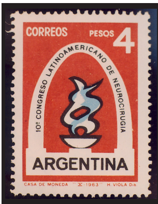
Fig. 11.— Correo argentino. 10º Congreso Latinoamericano de Neurocirugía, 1963.