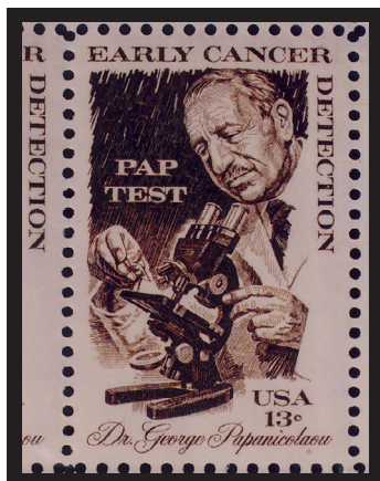
Fig. 4.- George N. Papanicolaou. Correo de EE. UU., 1978. Célebre por la detección precoz del cáncer.