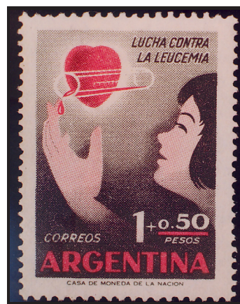
Fig. 8.- Correo argentino. Lucha contra la leucemia, 1958.