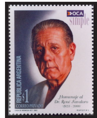
Fig. 17.— René Favaloro. Homenaje. Correo privado OCA. Argentina, 2001.