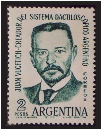
Fig. 10.— Juan Vucetich. Correo argentino, 1962. Creador del sistema dactiloscópico argentino.