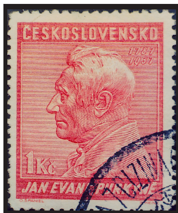
Fig. 2.- Johannes Evangelist Purkinje. Correo checoslovaco, 1937. Fisiólogo descubridor de las células del cerebelo que llevan su nombre.