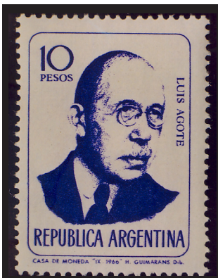
Fig. 12.— Luis Agote. Empleo de anticoagulante para la transfusión sanguínea. Correo argentino, 1966.