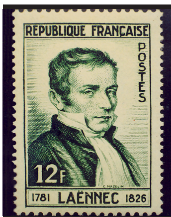
Fig. 5.- René-Théophile-Hyacinthe Laennec. Correo de Francia, 1952. Inventor del estetoscopio.