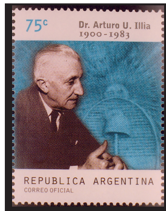
Fig. 7.- Arturo U. Illia. Correo argentino, 2000. Centenario de su nacimiento. Médico y Ex Presidente de la República.