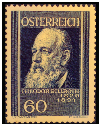
Fig. 1.- Christian Albert Theodor Billroth. Correo austriaco, 1937. Pionero de la cirugía gastrointestinal.