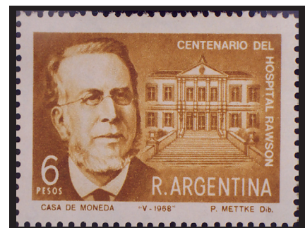
Fig. 18.— Hospital Rawson. Centenario de la Fundación. Correo argentino, 1968.