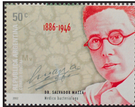
Fig. 14.— Salvador Mazza. Médico bacteriólogo. Correo argentino, 2002.