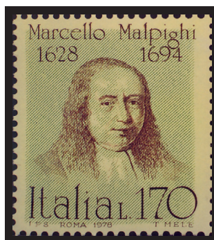
Fig. 6.- Marcello Malpighi. Correo de Italia, 1978. Descubridor del glomérulo renal y los corpúsculos de la pulpa blanca del bazo.