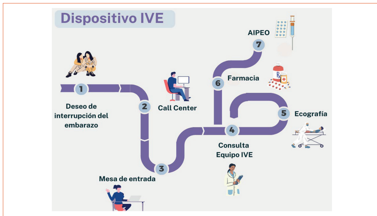
Figura 3 | Descripción gráfica del itinerario del usuario dentro del dispositivo interrupción voluntaria del embarazo

IVE: interrupción voluntaria del embarazo; AIPEO: anticoncepción inmediata post evento obstétrico